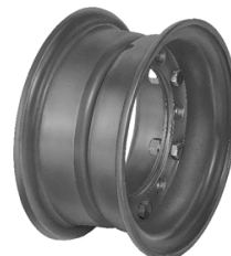
Dělený ráfek pro aplikaci pneumatik SOLIDEAL