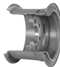
Ráfek Lemmerz pro aplikaci pneumatik SOLIDEAL