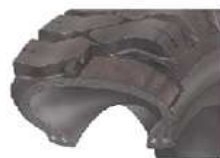
Řez vzdušnicovou pneumatikou SOLIDEAL