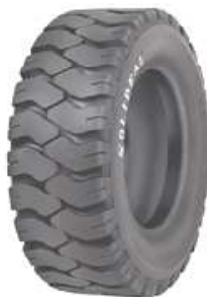
SOLIDEAL EXTRA DEEP